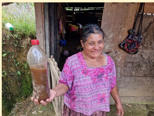
Maskodlingen ger också flytande ekologisk gödsel