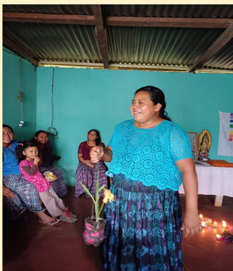
Efter lyckosam odling delar kvinnorna Plantor och sticklingar med varandra